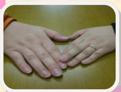
ご結婚が決まった Xmasイベントカップル♡