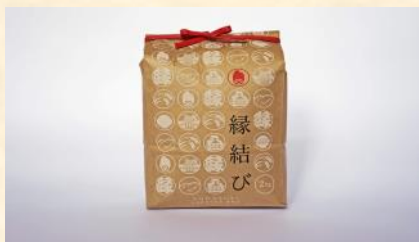
①『縁結び米 2kg』 小泉農産様より