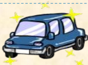
⑤『洗車&車内クリーニング』 魚沼自工様より