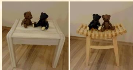
②『赤松スツール又は桐スツール』 秀和建設様より