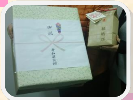
赤松ミニスツールと縁結び米 をプレゼントしました！ ◆秀和建设様、小泉農産様より