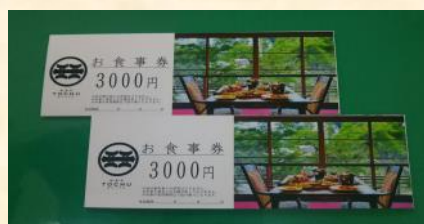
④『東忠お食事券』 小千谷市産業開発センターより