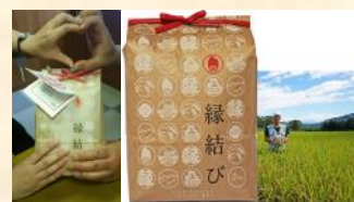
記念品：小泉農産様 他

●1対1のお見合いで、ゆっくりお話をして、いい出会いができました。時間がかかりましたが、納得できるかたちで一緒になることができました。ありがとうございました。（市内40代男性♥市外40代女性）