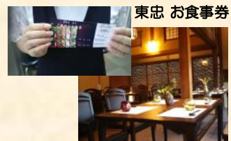
記念品：小千谷市産業開発センター 他