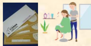
記念品：クリエイトYON様 他