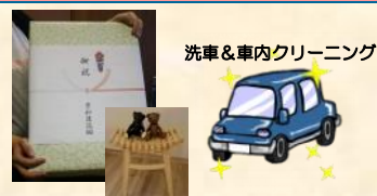
記念品：秀和建设様・魚沼自工様 他