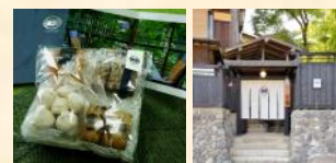
記念品：居食亭東忠様 他